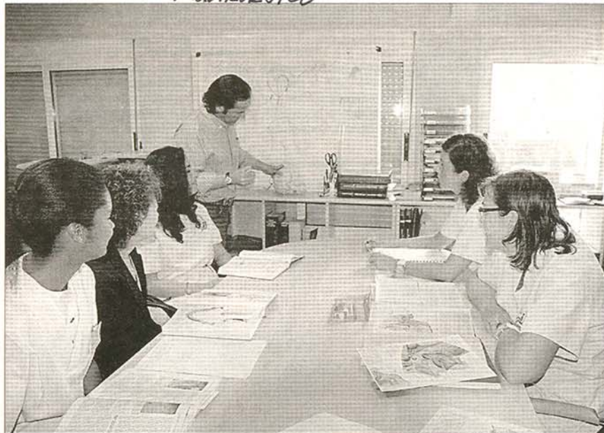
El equipo de profesionales en una de las clases de formación, en la clínica.