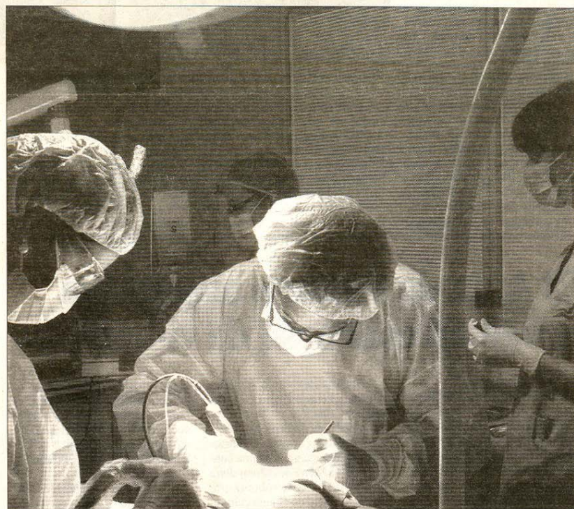
Un momento en el que se lleva a cabo una intervención en el quirófano.