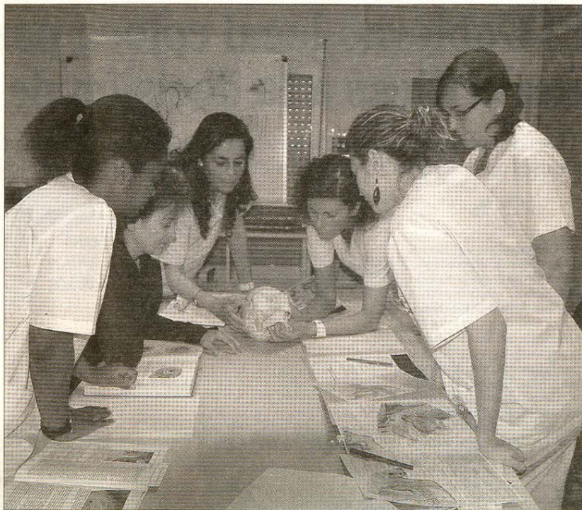
El equipo de profesionales en uno de los cursos de formación de la clínica.

-Quizás el perfeccionamiento en la cirugía de implantes, que los ha convertido en una intervención banal y casi siempre con un post-operatorio absolutamente indoloro. También resaltaría el aumento desde el punto de vista científico de los muchísimos e importantísimos trabajos que se hacen en las clínicas sin la presencia del paciente para incrementar la calidad del trabajo, tanto la mejora de las técnicas como el alcance de la esterilización a las dependencias en las que llevamos a cabo nuestro trabajo. Algo así como la optimización de la higiene y de la esterilización. Esto es una de las cosas que más tranquiliza al paciente.